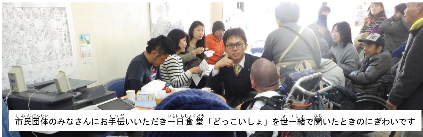
しみんだんたい てつだ いちにちしよくどう 市民団体のみなさんにお手伝いいただき一日食堂「どっこいしょ」を世一緒で開いたときのにぎわいです